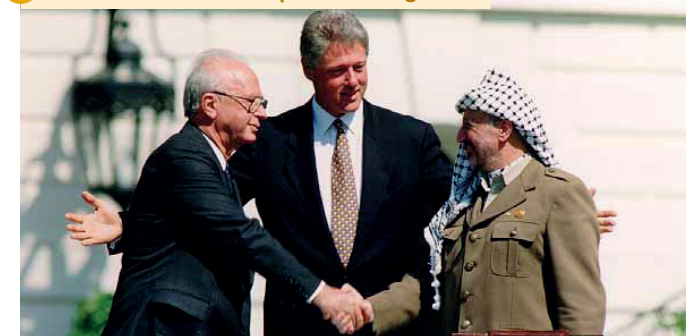
Yitzhak Rabin —primer ministre d'Israel—, Bill Clinton —president dels Estats Units— i Yasser Arafat en els acords d'Oslo (1993)