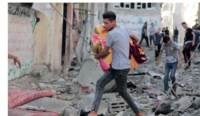
Conseqüències d'un atac aeri de l'exèrcit israelià a la Franja de Gaza

Avui les posicions radicals guanyen cada cop més adeptes tant entre jueus com entre palestins.